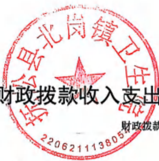
财政拨款收入支出决算总表